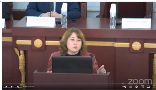
06.05.22, 14:00 | Prelegere - Provocări economice și demografice în dezvoltarea Republicii Moldova